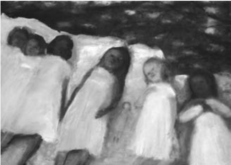
Miwa Ogasawara, »grau«, 185 x 260 cm, 2006

Die Malerei wirkt leicht, fast beiläufig, und ist meist von schattenhaftem Grau durchtränkt. Je länger man schaut, desto reicher tritt darin eine Vielfalt fahler Zwischentöne hervor, entzündet ein blasses Glühen, in dem Figuren und Landschaften wie zur Unwägbarkeit geformt sind. In der malerischen Umsetzung löst sich das Beiläufige in eine traumartig zeitenthobene Gegenwart auf. Im farbigen Helldunkel sind die Konturen nahezu aufgelöst, und dadurch, wie Ogasawara das Leichte aus diffussem Schwarz heraus aufbaut, wie sie es über punktuell gesetztes helles, dann