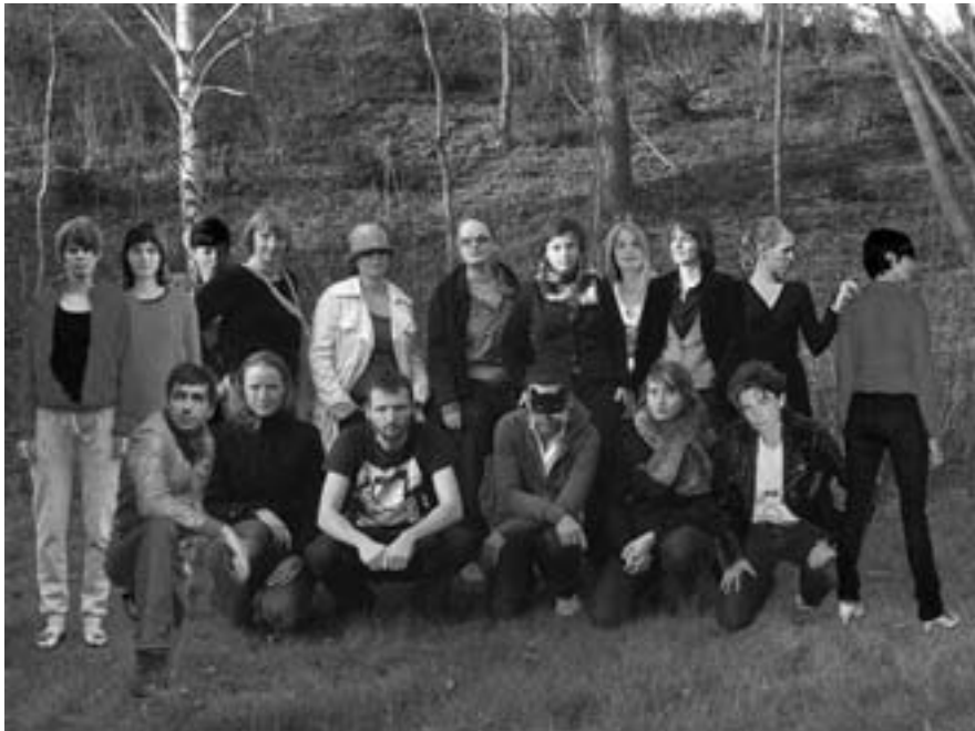
Die teilnehmenden Künstler und Künstlerinnen

Mit der Ausstellung im Kunstverein Harburger Bahnhof e.V. reagieren 16 Künstlerinnen und Künstler auf diese aktuelle Entwicklung. Der Titel der Gruppenausstellung »Wir sind wieder wer« beschwört mit ironischem Optimismus die Idee gemeinsamer Stärke herauf und ist gleichzeitig als Kritik gegen den Umgang mit Kunst als Ware zu verstehen.