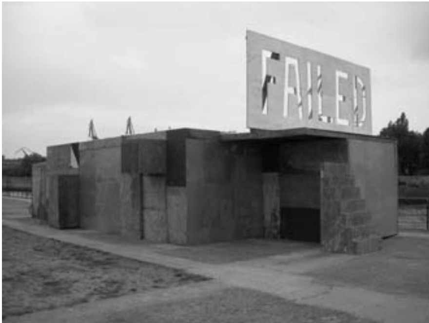
Berndt Jasper, »Baltic Raw Flow«, Installation, 2006

»Entdecke dich selbst, aber verrate es dir nicht. Bringe es in Umlauf, aber vergiss wer du bist.« Mit diesen Worten zur Aufgabe des Künstlers liefert Berndt Jasper eine bezeichnende Stellungnahme. In der Unmöglichkeit, eine Kategorie für seine