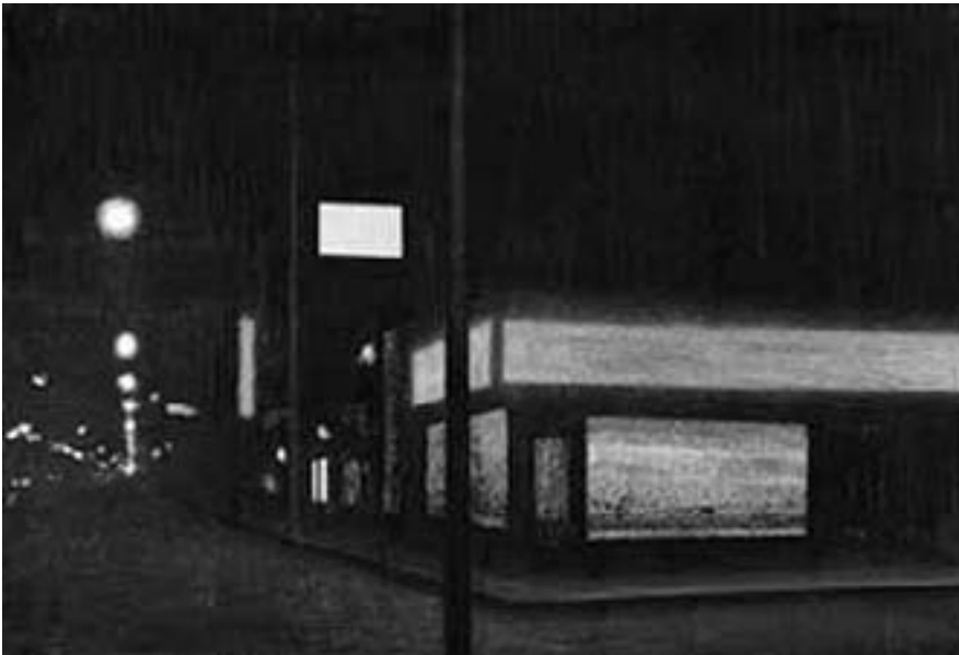
Achim Hoops, »Eine Art Schwarz«, Ausstellung bei art agents gallery

tom-, geisterhaften Präsenz. Der Künstler selbst verweist auf ein kunsthistorisches Vorbild, das ihm in den Darstellungsmitteln weit näher steht: die Zeichnungen von Georges Seurat. Die auf dem rauen Papier nur teilweise deckende Kreide führt zu einer grobkörnigen Struktur, die den Motiven eine schemenhafte Präsenz verleiht, die im Gegensatz zu den oft harten Konturen in Seurats pointillistischen Gemälden steht. Neben der intensiven und von der naturalistischen Lichtverteilung oft abweichenden Darstellung künstlicher Beleuchtung ist auch die fast konstruktivistisch anmutende Unterteilung des Bildfeldes durch rechtwinklige oder diagonale Abgrenzungen und Rahmungen ein Stilmittel Hoops', das jedoch eher an Seurat als an Hopper erinnert. Das stark »konstruktive« Element der Bilder entspricht auch der Tatsache, dass die Bilder selbst eher eine mentale Konstruktion sind, als dass sie eine äußere Realität wiedergeben.