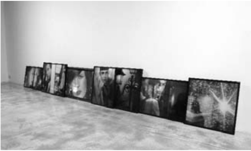
Marie José Burki, »Horizons of a World«, Installationsansicht

die Lampe und das leere Herz, der Rasen und die Selbstverliebtheit. Wertfrei und zumeist ohne Ton zieht alles in langsamen Travellings vorüber, die Deutung der exemplarischen Informationen steht dem Betrachter frei.