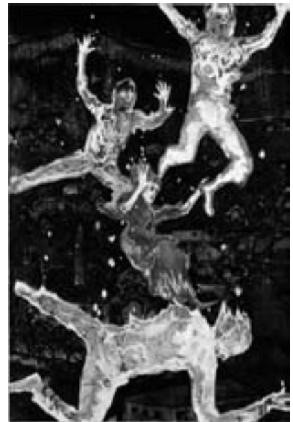
Daniel Richter, »duueh«, 300,4 x 200,2 cm, 2006

formatige Bilder und erstmals eine Auswahl aus der so genannten DRK Reihe: mehr als 400 kleine Formate, die Richter als Ideenskizzen und Tagebuch gleichermaßen dienen. Daniel Richter studierte bei Werner Büttner an der Hamburger Hochschule für bildende Künste und arbeitete als Assistent von Albert Oehlen. Zunächst entstanden abstrakte Gemälde, deren farbstarker, psychedelisch anmutender Formenkosmos sich zwischen Graffiti und verschlungenen Ornamenten be-