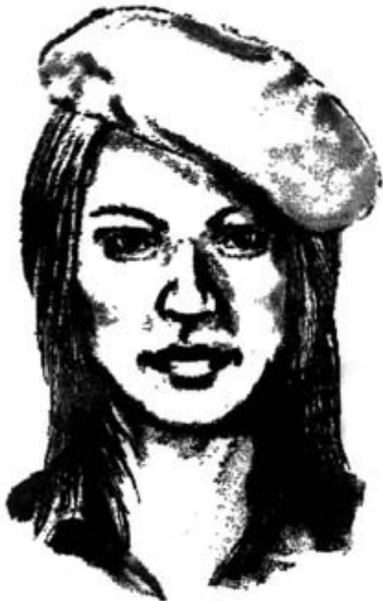
Michaela Melián, »Tomboy« (Stempel), 1994

dem Platz zugewandte Fassade reduziert, sie bilden die Begrenzung der Hüpffläche, die wiederum den Proportionen des Platzes entspricht. Die vier Eingänge der Hüpfburg entsprechen den Zugängen des Platzes.