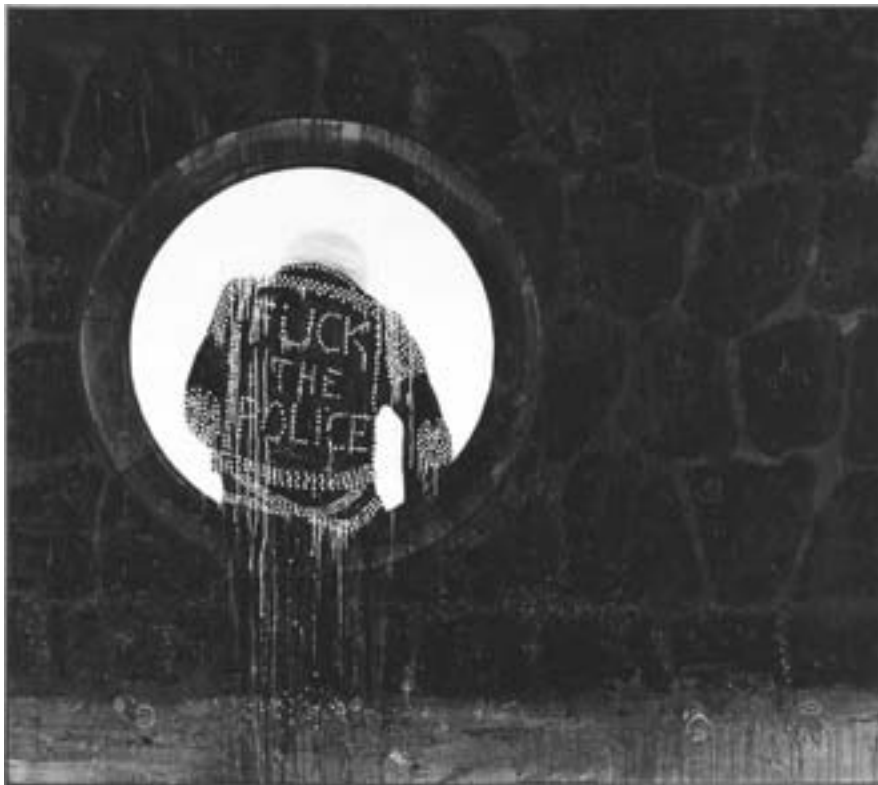
Daniel Richter, »lonley old slogan«, 250 x 280 cm, 2006

In seinen großformatigen Ölgemälden verschränkt Richter kunsthistorische, massenmediale und popkulturelle Versatzstücke zu eigenwilligen, narrativen Bildwelten. Die Ausstellung gibt einen Überblick über zwölf Jahre malerischen Schaffens und entstand in enger Zusammenarbeit mit dem Künstler. Sie zeigt über 50 groß-