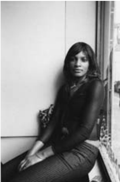
Jitka Hanzlová, aus der Serie »Caribbean Africans«, 2002