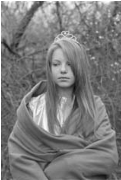
Janina Wick, »Kimberly«, 2007, C-Print