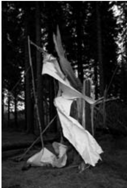
Philipp Gaißer, »Misadventure«, 2007, C-Print, 115x95 cm