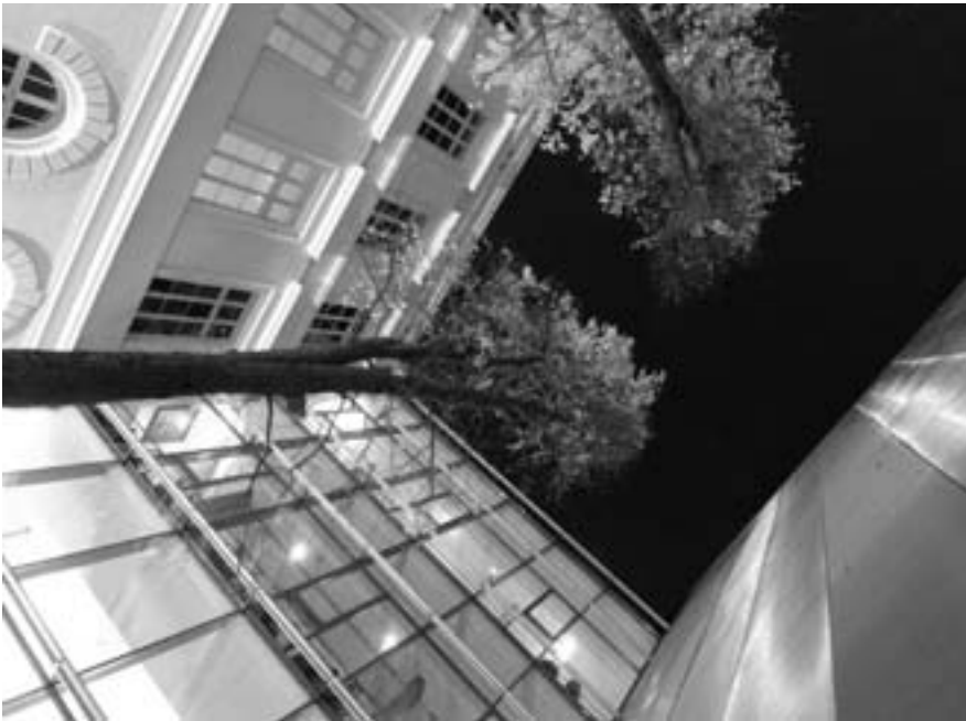
Museum für Kunst und Gewerbe, Innenhof